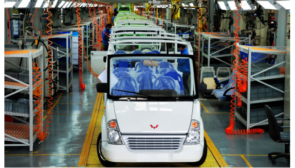
專用車裝配生產線