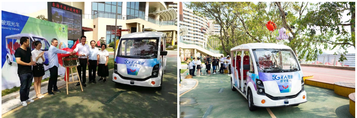
景區中5G智能駕駛觀光車的使用情況

本集團正式推出5G智能駕駛觀光車，並於中國浙江省東海半邊山旅遊度假區試行商業化營運。該景區為浙江省首個5G無人駕駛體驗景區，由中國電信寧波分公司提供網絡解決方案，華為技術有限公司提供5G網絡的關鍵技術和產品，五菱工業提供智能駕駛車輛。五菱工業在技術上、網絡上、現場安全員、車輛維護保障等方面為客戶提供無人駕駛觀光車的多重安全保障措施，確保車輛安全、穩定地運行。在技術上，五菱工業結合了獨立感知系統和5G網絡通訊感知系統，使觀光車具備循跡導航、自動避障、停車緩衝等功能，而其行駛過程中亦做到安靜、零污染及零排放。