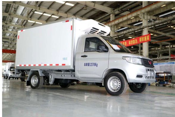
完成國六升級的五菱客車產品(左圖)及冷藏車(右圖)